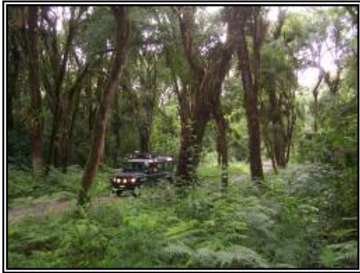
“Reserva Forestal La Florida – Selva de Yungas”

Una vez ya en Tafí del Valle, allí en medio de un paisaje de impactante belleza, se encuentra “Estancia Las Carreras” (Valle de las Carreras) en donde los pasajeros se hospedarán y podrán disfrutar del confort que sus instalaciones brindan. Almuerzo de bienvenida. Resto de la tarde libre. Cena en el restaurant de la estancia.