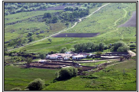
“Estancia Las Carreras”

Opcional: Actividades propias de la estancia.