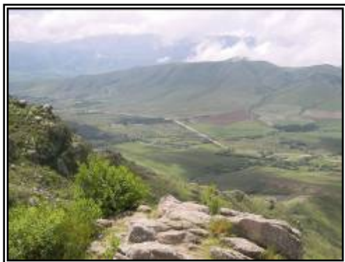
“Valle de Las Carreras”