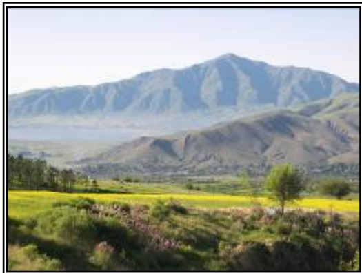
“Vista panorámica Tafí del Valle”

Luego de desayunar, siendo las 10:00 hs de la mañana, salimos desde la Estancia Las Carreras con destino Ruinas de Quilmes, durante el trayecto visitaremos los distintos puntos de interés: reserva arqueológica La Bolsa, El Infiernillo (punto más alto 3.042 m.s.n.m.), Los Cardones, Ampimpa. Para sentir un poco de aventura haremos un 4x4 por el Río Los Zazos, en el cual combinaremos aventura, paisajes desérticos y cultura.